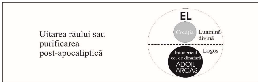
Fig. 4 Uitarea ca iad sau întunericul cel de dinafară pentru Adoil și Arcas

Până la urmă, Apocalipsa , „romanul mitologic” al lui Ioan, nu este decât trista expunere a unei duble tragedii personale, a lor și a noastră, repede acoperită de haina peticită a optimismului creștin ce nu face altceva decât să amâne pentru un timp nedefinit rezolvarea problemei răului (cf. Apoc., 20 1-3), fără a avea puterea reală de a o definitiva. Aceasta se întâmplă tocmai pentru că Dumnezeu, creatorul nostru, nu poate ucide pe cei ce nu i-a creat și de aici eternele chinuri ale iadului ce opresc procesul integrării ființelor damnate în Adoil și Arcas.