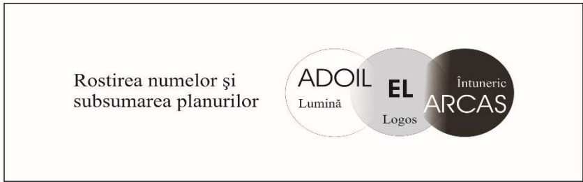
Fig.2 Materializarea zeilor superiori și descoperirea numelui lui El face transferul dinspre superioritate la egalitate și inferioritate după deșertare sau sacrificiu.