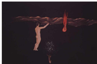
Fig. 2: Victor Brauner ( http://surrealism.website/brauner.html )