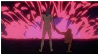
Fig. 1. La Planète sauvage

În concluzie, filmul Planète sauvage constituie o sursă proprie pentru a reprezenta conceptul de proxemică , conflictele iscate din cauza diferențelor ce definesc ființele destinate să conviețuiască în același spațiu și modul în care acesta este perceput de fiecare suflet în parte.