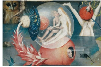
Fig.4. Hieronymus Bosch ( https://www.google.ro/search..... )